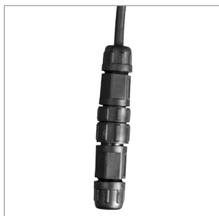
connectiques mâle & femelle IP 68 pré-installées