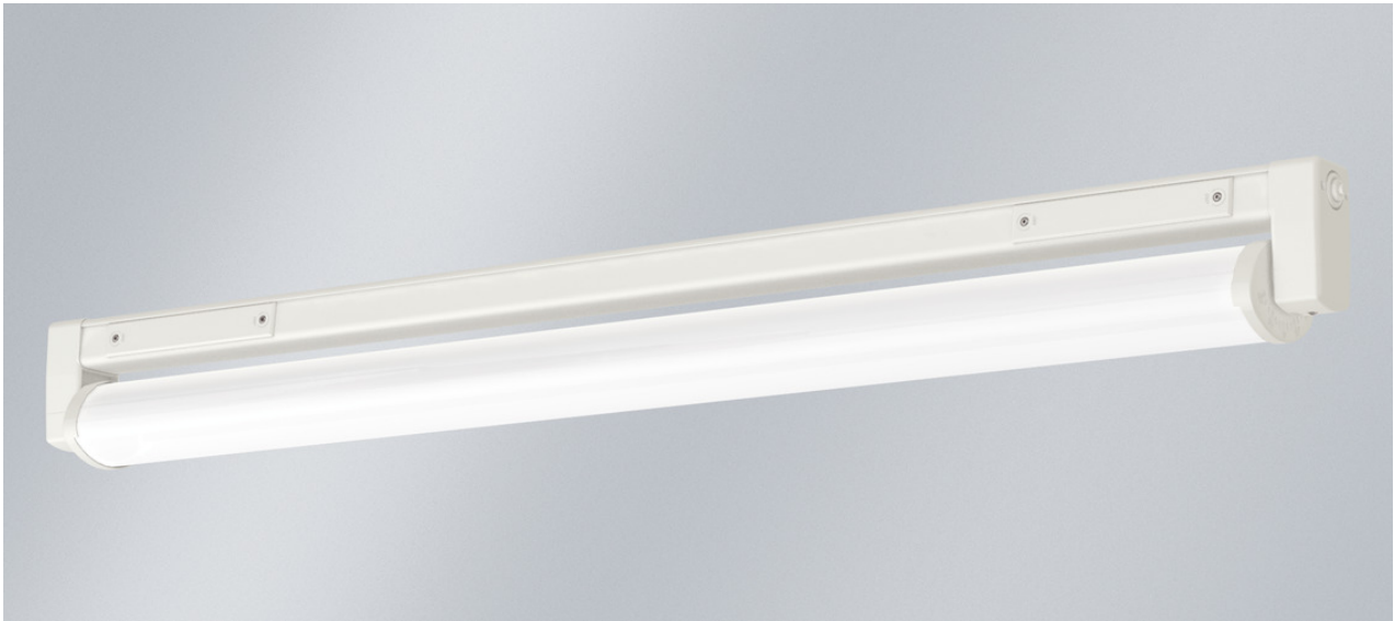
L'illustration peut différer