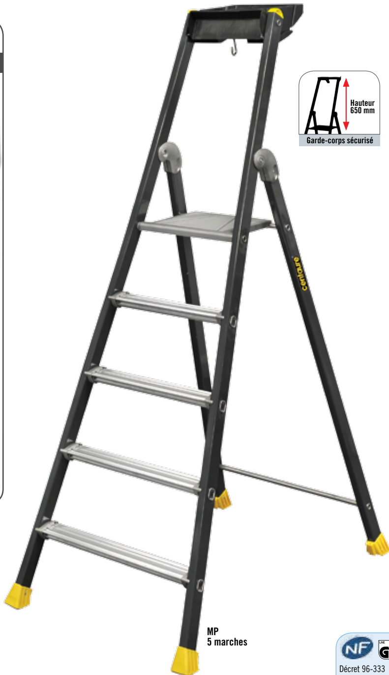
MP 5 marches