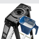
MINI BAC 382200