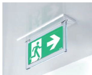
Cadre d'encastrement avec enjoliveur