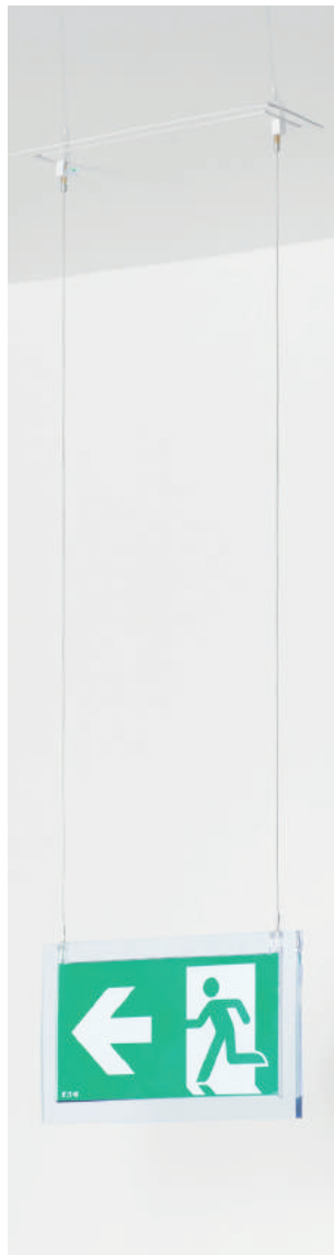
Kit de suspension + cadre d'encastrement