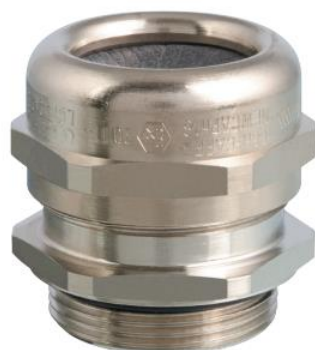
Presse-étoupe en laiton