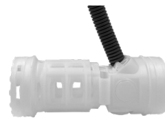
ICTA 3 x 20 + Gaine ICT 25 connectée CAP959955