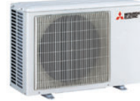
MUZ-HR 42/50 VF