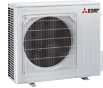
MUZ-HR 60/71 VF