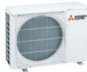
MUZ-HR 25/35 VF