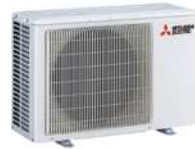
MSZ-LN 25/35 VG2