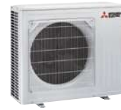
MSZ-LN 50 VG2