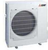
MSZ-LN 60 VG2