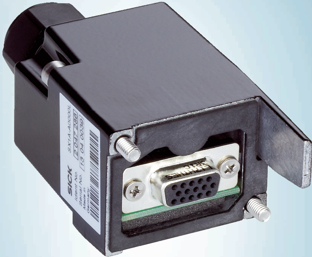
SX1A-A0000L Connecteur système S3000