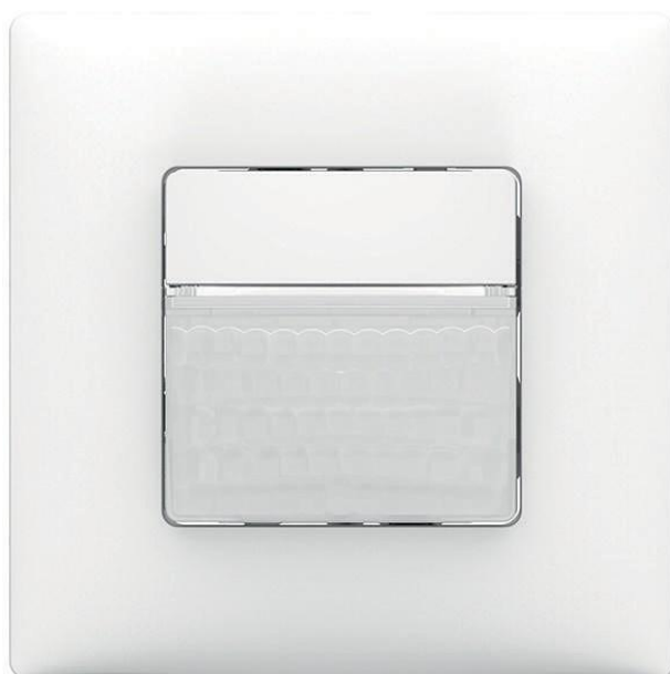
theMura S180-100 UP WH