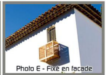
Photo E - Fixé en façade