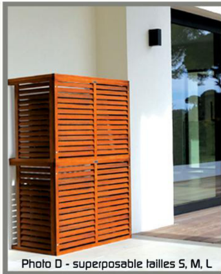
Photo D - superposable tailles S, M, L