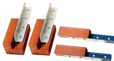
Kit rallonge profondeur (de 10cm)