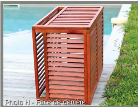
Photo H - Face de derrière