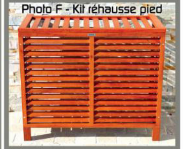
Photo F - Kit réhausse pied