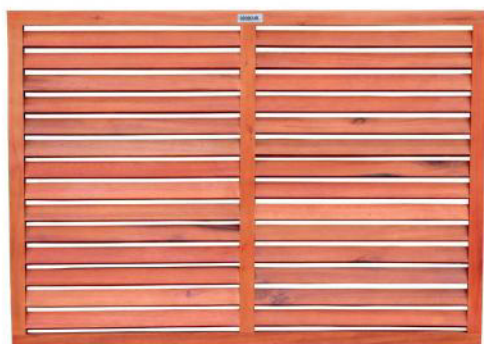
Face de derrière DECOCLIM®