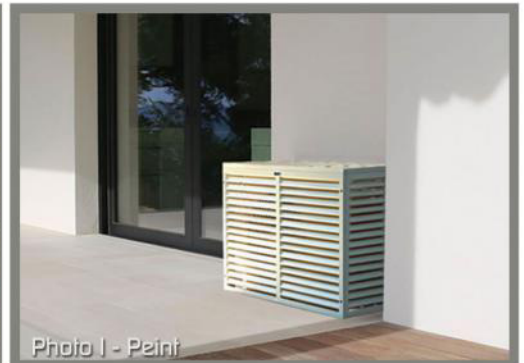
Photo I - Peint

Une notice de montage est disponible dans chaque colis ainsi que tout ce qui est nécessaire à son assemblage. DECOCLIM® vient comme une solution aux équipements, aujourd'hui adoptés en matière de confort. A l'heure où beaucoup de personnes optent pour ces énergies nouvelles, les climatisations réversibles et les pompes à chaleur arrivent en masse.