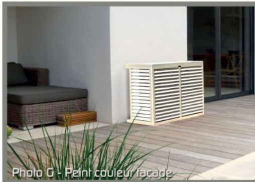
Photo G - Peint couleur façade