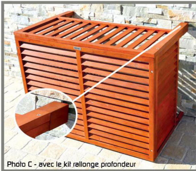
Photo C - avec le kit rallonge profondeur