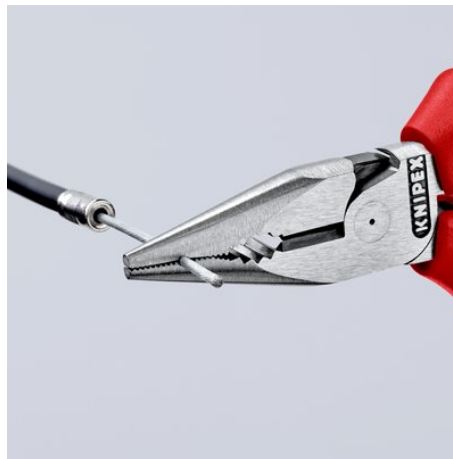
Rainurage fraisé dans la zone de saisie