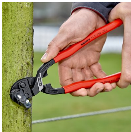
actionnement à deux mains pour une puissance de coupe maximale