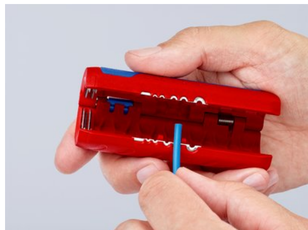
90 22 02 SB : graduation injectée pour un dénudage homogène sur une longueur uniforme, lisible pour les droitiers et les gauchers