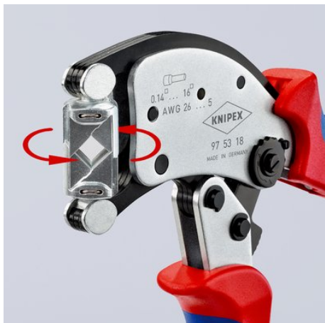
Tête de sertissage rotative à 360° pour une meilleure accessibilité, même dans des espaces exigus