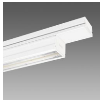
6601 Techno System - asymétrique 25° - CRI 90