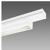
6615 Techno System HE - extensif 60° - CRI 80