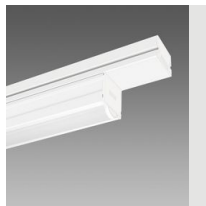
6605 Techno System - diffuseur hémisphérique extensif - CRI 90