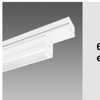
6616 Techno System HE - diffuseur hémisphérique extensif - CRI 80