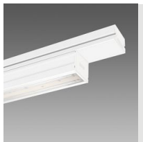
6602 Techno System - asymétrique double 25° - CRI 90