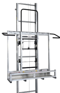
CADRE À PLAQUES HORIZONTAL / VERTICAL