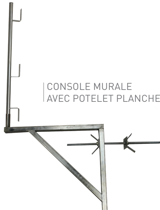
CONSOLE MURALE AVEC POTELET PLANCHE

Toutes les précautions doivent être prises pour empêcher la chute accidentelle des personnes lors de la mise en place et du démontage des consoles et garde-corps.