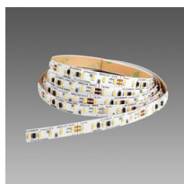
Strip - LED 24V - CRI>90