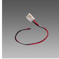
Connecteur avec câble - Strip LED IP20