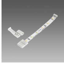
Connecteur pour ligne continue - Strip LED IP20