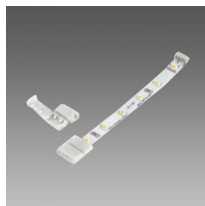
Connecteur pour ligne continue - Strip LED IP20