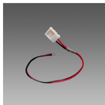
Connecteur avec câble - Strip LED IP20