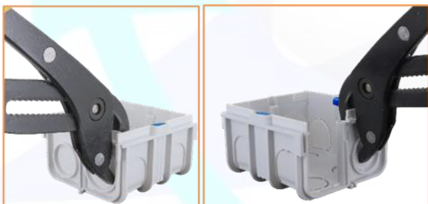
A l'aide d'une pince, retirer les deux parties sécables autour du puit de fixation