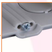
Caches de protection des vis