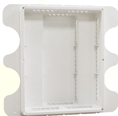
Couvercle lisse, équipé d'un joint étanche + 6 vis ¼ de tour

Désignation : Réservations hydrauliques Matière : ABS-PC Couleur : Blanc RAL 9016 Tenue au fil incandescent : 960°C Fonction : Une boîte de réservation permettant d'accueillir les nourrices eau chaude et eau froide, les circuits hydrauliques de l'habitat individuel (et le circuit chauffage selon le modèle choisi), et de faciliter leur passage. Pose murale ou plafond avec entraxe 500 ou 600 mm sur rails. Les + produit : Bac léger et robuste / L'étanchéité et son design / Fermeture 6 vis 1/4 de tour imperdables.