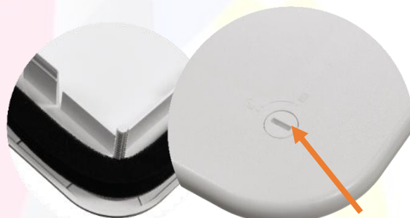
Vis ¼ de tour pour la fixation