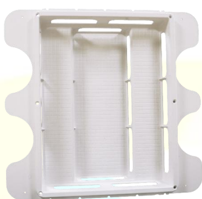
Couvercle lisse, équipé d'un joint étanche + 6 vis ¼ de tour