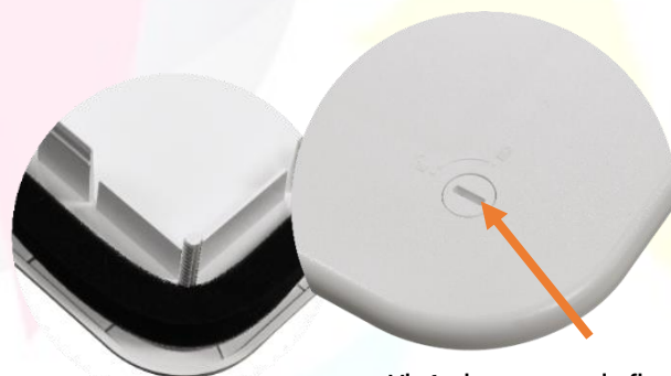
Vis ¼ de tour pour la fixation