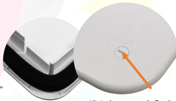
Vis ¼ de tour pour la fixation