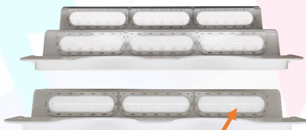
Membrane fendue pour le passage des conduits PER