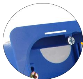
Repères de découpe