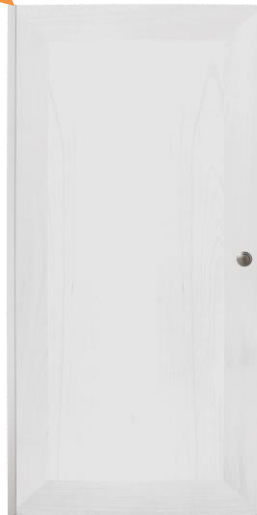
Porte blanche bois massif et mélanimé