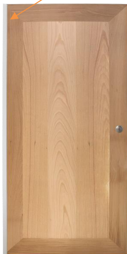
Porte bois massif

Grand angle d'ouverture grâce à la bande pivot