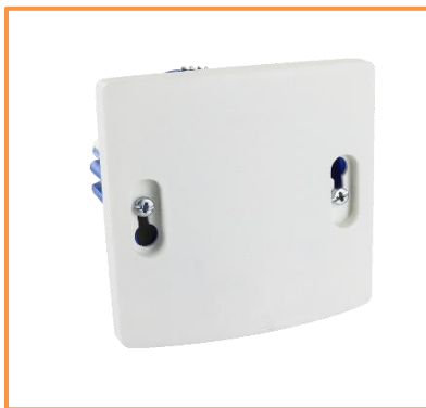
Fixer la sortie de câble à l'aide des vis d'appareillage. L'alignement peut être ajusté simplement.