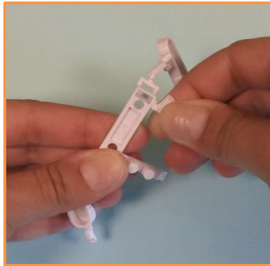
Détacher chaque élément