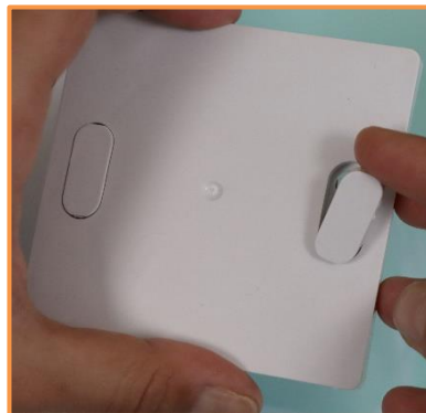
Insérer les capuchons de finition dans leur logement