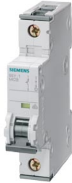
disjoncteur modulaire Icu=15KA 230/400V 1P C40