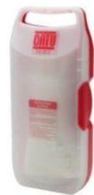
Boîte à gants CG-35/2