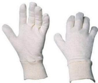
Sous-gants coton CG-80