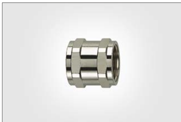
Coupleur HelaGuard ACP.