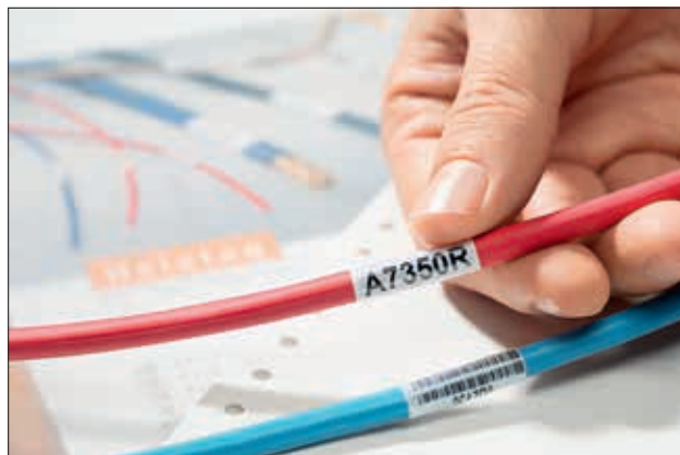
L'emballage assure une protection exceptionnelle des étiquettes.