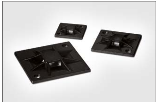
Embases adhésives ou à visser de la série Q.