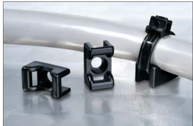
Embases de la série KR, en application.