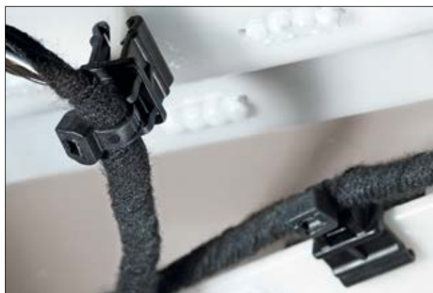
Lanières de la série EC en application.