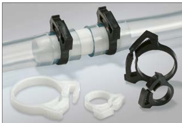
Eléments de fixation de la série SNP, en application.