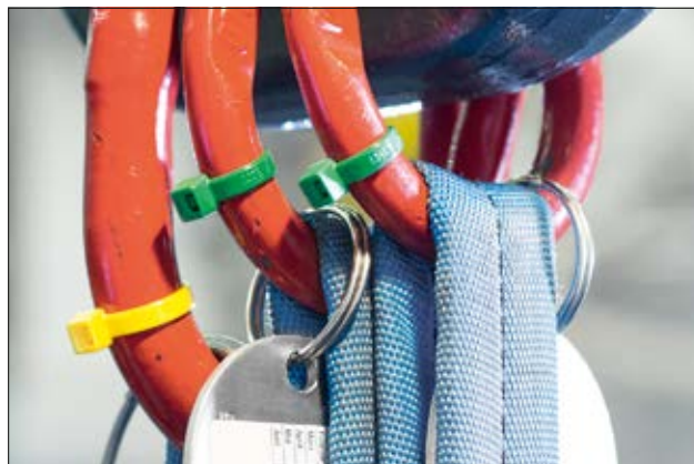
Colliers à tête carrée de la série T - De couleurs pour un repérage des câbles.