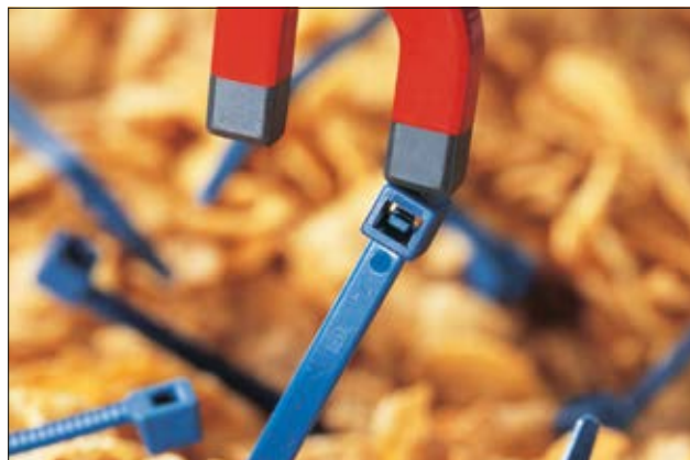
Les colliers détectables de la série MCT sont d'usage courant dans les industries agro-alimentaire et pharmaceutique.