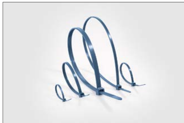
Colliers MCTPP - Colliers détectables bleus disposant d'une bonne résistance chimique.