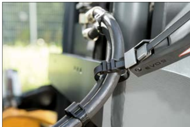
Collier d'installation de la série LPH.