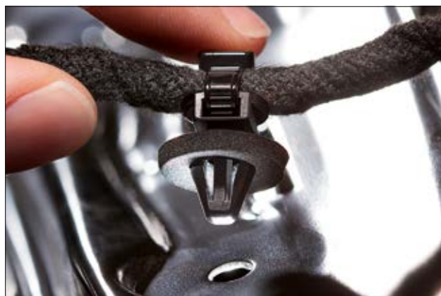
La mousse d'étanchéité offre une protection contre les infiltrations d'eau.