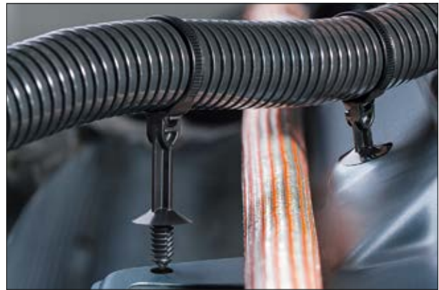
Lanière avec déport T50ROSFT_SO en application.