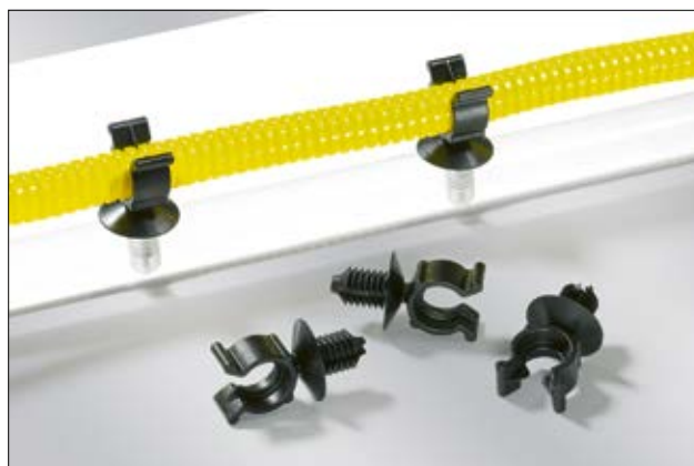
Éléments de fixation de la série CTC pour gaines annelées, en application.