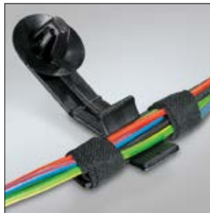
Clip à enrubanner avec départ, en application.