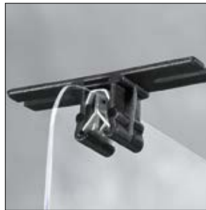
Clip à enrubanner EC15 en application sur un rebord de panneau.