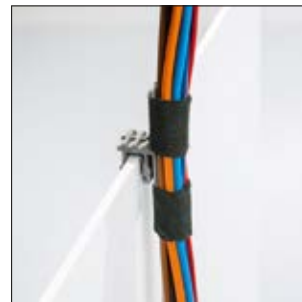
Les câbles et faisceaux peuvent être fixés avec un collier ou du ruban adhésif sur la barre du clip à enrubanner.