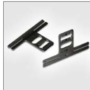
Clips à enrubanner de la série BC, compacts, flexibles et adaptables.