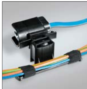
Clip à enrubanner TCB5CYCC, en application, offrant la possibilité de clipser un connecteur.