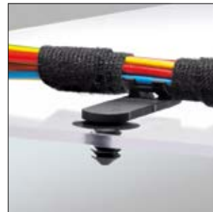
Clips à enrubanner avec pied sapin, avec départ.