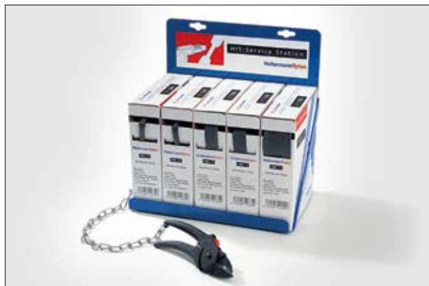
HIS Service Station contient 5 dévidoirs et un outil de coupe.