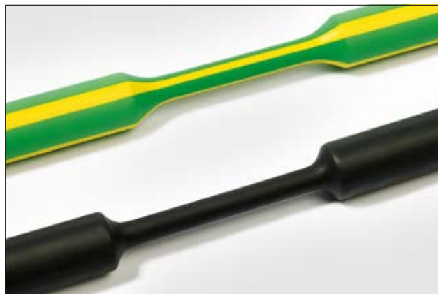
TREDUX à paroi fine.