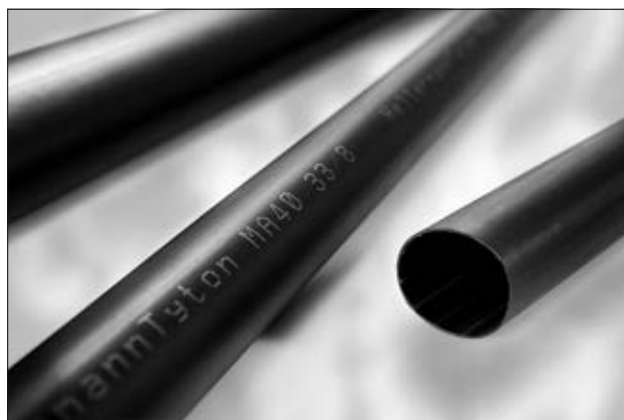
Gaine thermorétractable MA40 à paroi moyenne avec adhésif et retardateur de flamme pour la construction navale.