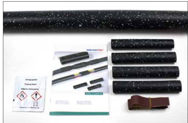
LVK - manchon extérieur, manchons intérieurs, lingette nettoyante, toile émeri, instructions d'installation.