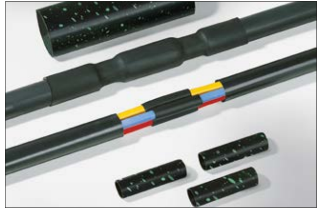
LVK - Gaine thermorétractable rectiligne.