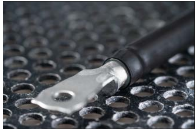
TA37 - Gaine thermorétractable sans halogène et auto-extinguible 3:1 paroi fine avec adhésif.